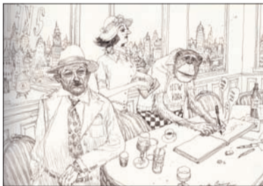
ニコラ・ド・クレシー